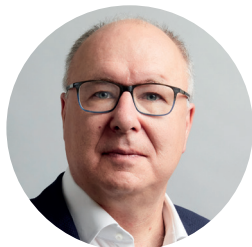
Pierre-Yves Maillard Président de l'Union syndicale suisse et conseiller national