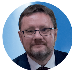
Dr Christian Bock Office fédéral de la douane et de la sécurité des frontières OFDF Directeur