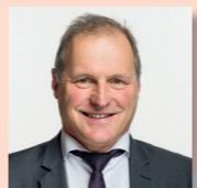
Pierre-André Page Conseiller national UDC

« La publicité fait partie de l'économie. Il doit être possible de faire de la publicité pour des produits légaux. C'est la raison pour laquelle je dis NON à cette initiative. »